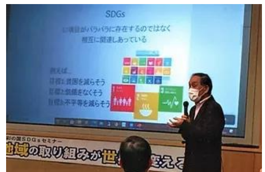
今後の助言展望 (民族フォーラム・赤石顧問)